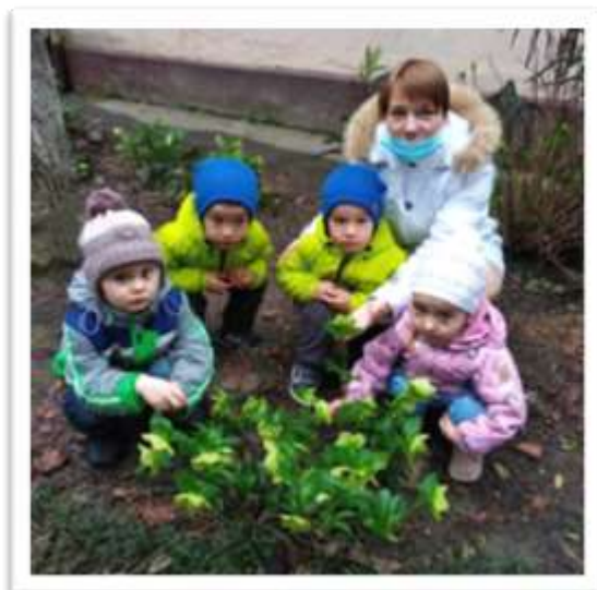
декоративно-прикладное занимательное дело «Подснежник»